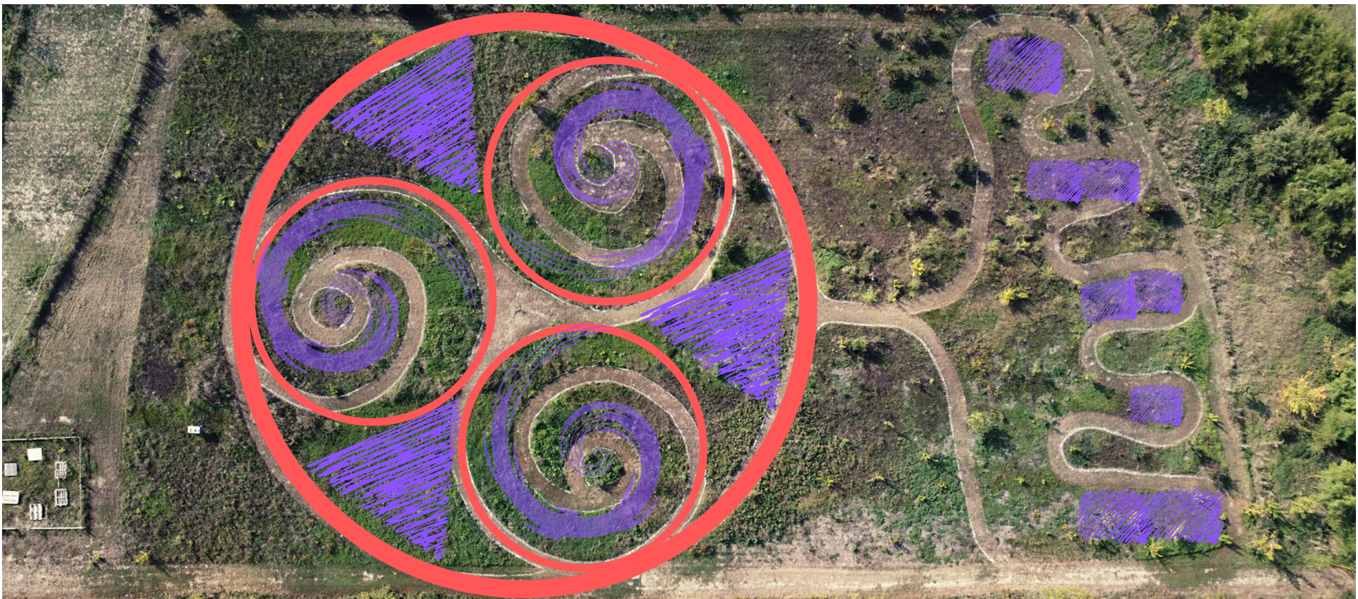
immagine area del sito sul quale sorgerà il giardino