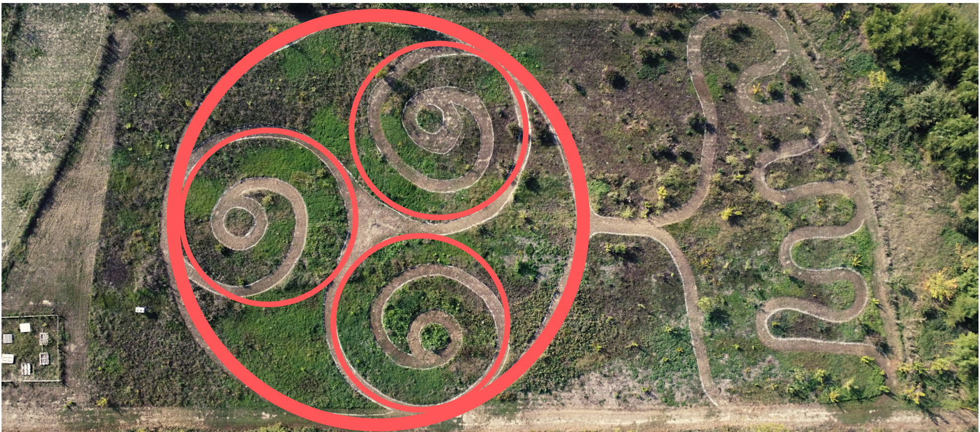
immagine area del sito sul quale sorgerà il giardino