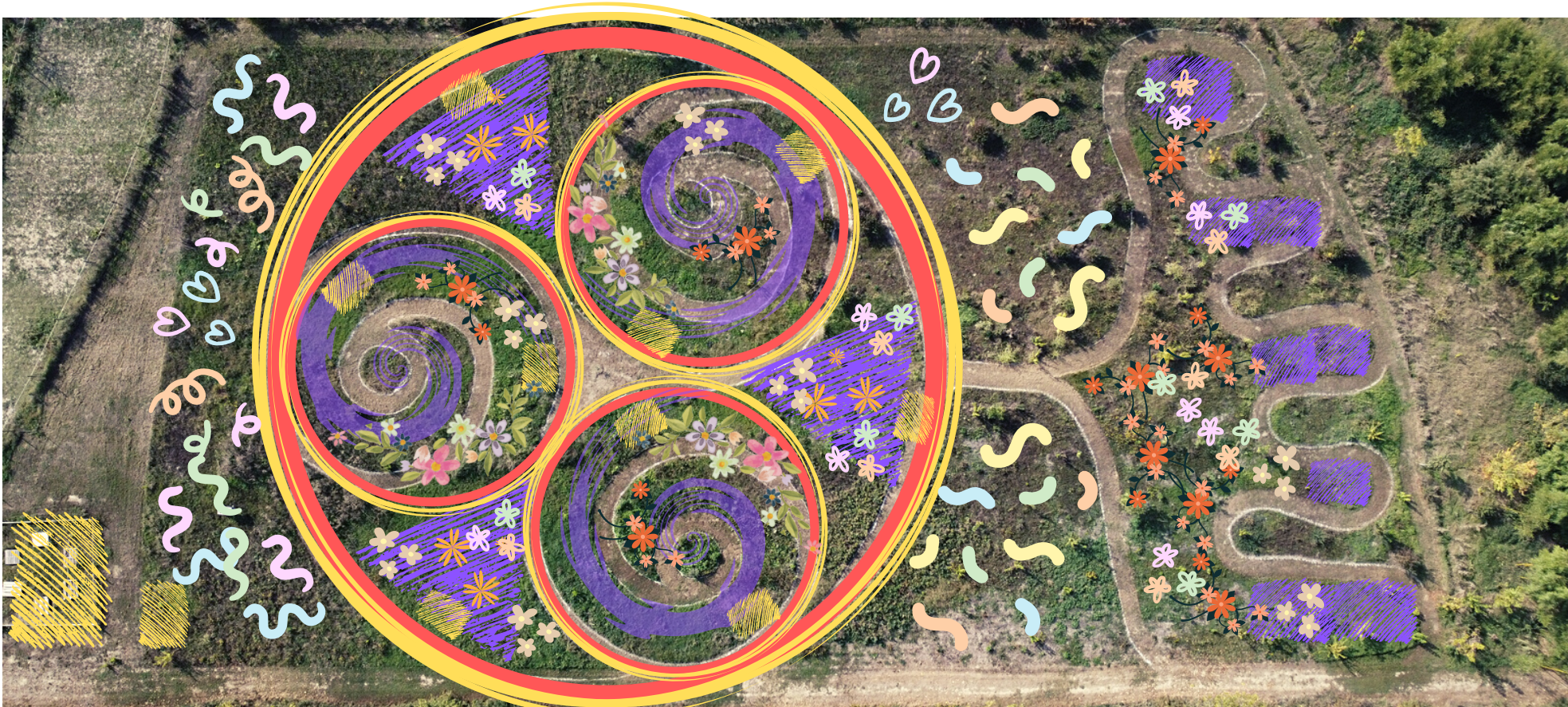
immagine area del sito sul quale sorgerà il giardino