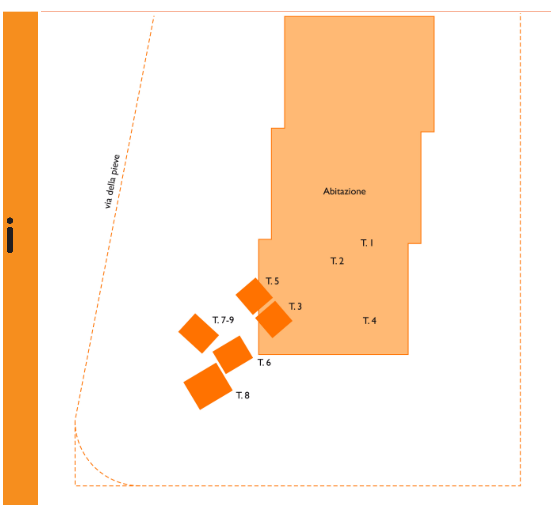
Planimetria del sepolcreto

da uno 'strato' di ciottoli. Le deposizioni, situate a una profondità variabile, compresa tra 1,80 e 2,40