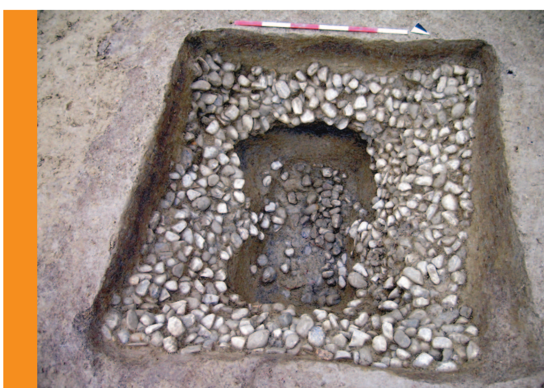
Una delle tombe con la cassa lignea ricoperta da ciottoli

Lavori di edilizia privata, svolti in località Marano di Castenaso nel corso del 2007, hanno portato in luce nove tombe di epoca villanoviana. I corredi,