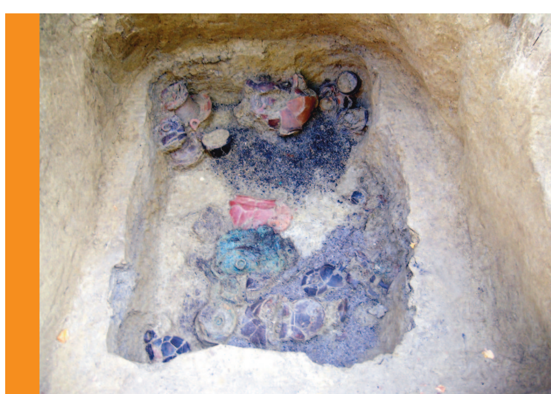
Il corredo di una sepoltura in corso di scavo

funeraria (ne sono state rinvenute sette, decorate e non), si disponevano lungo un asse orientato in senso