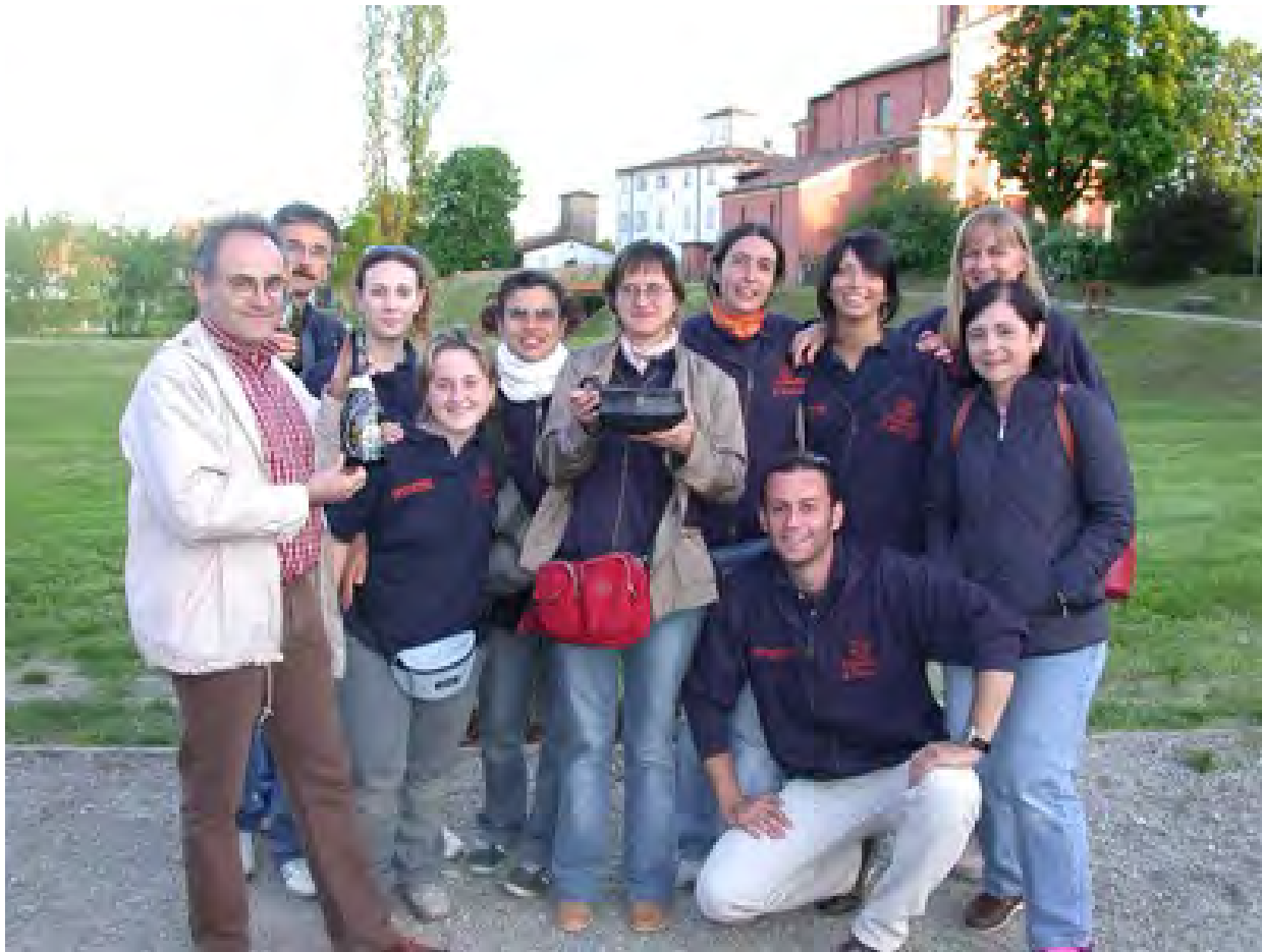
Lo staff del parco