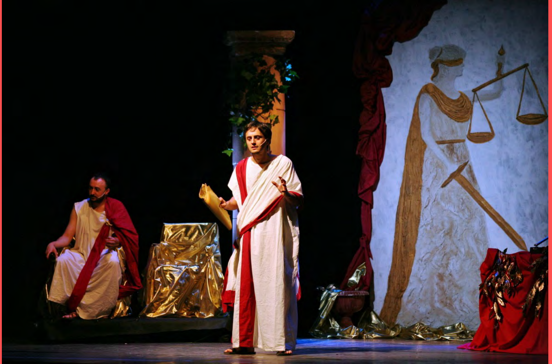
L'odore della morte (2008)