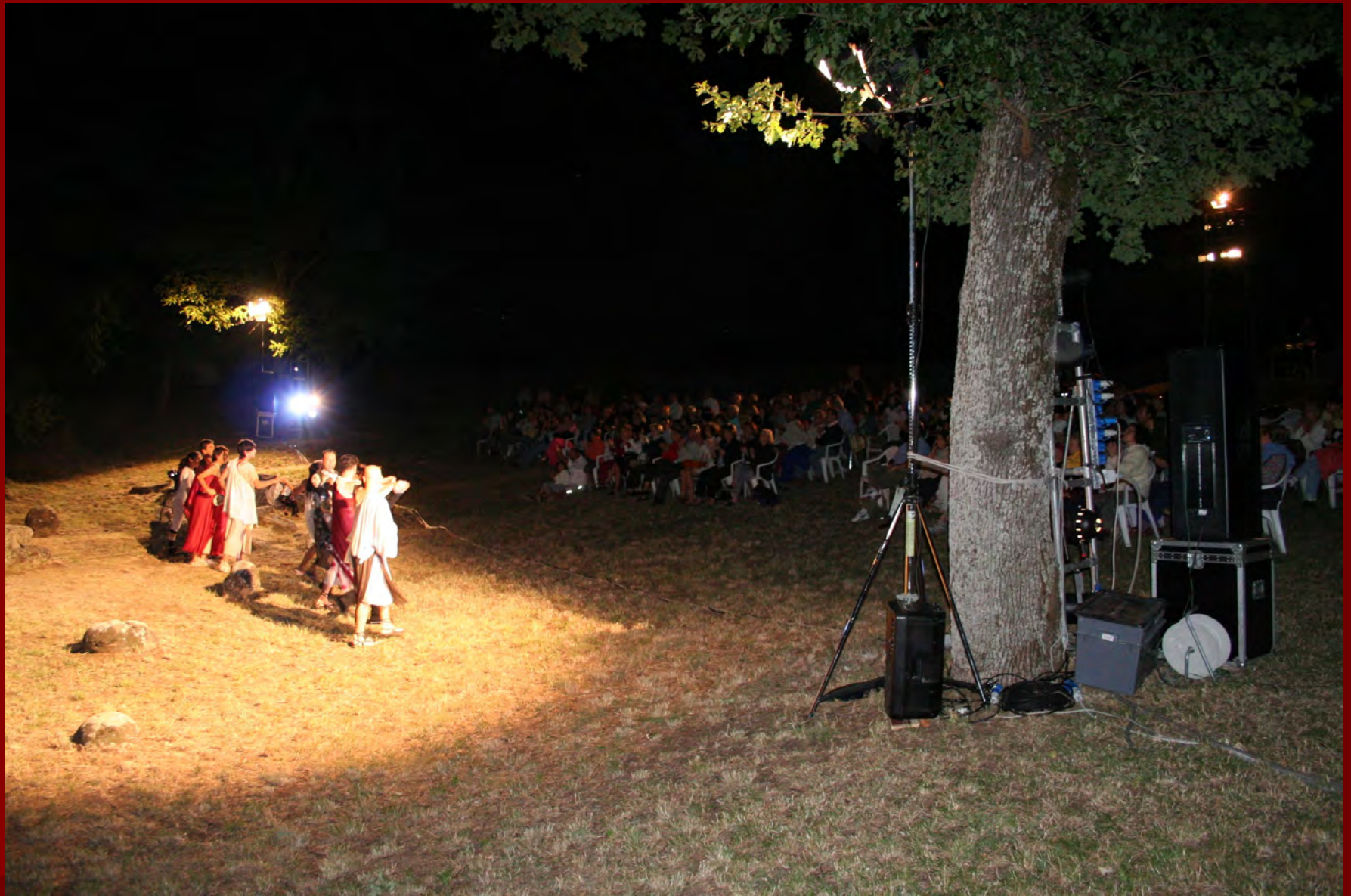
Necropoli orientale il pubblico del teatro