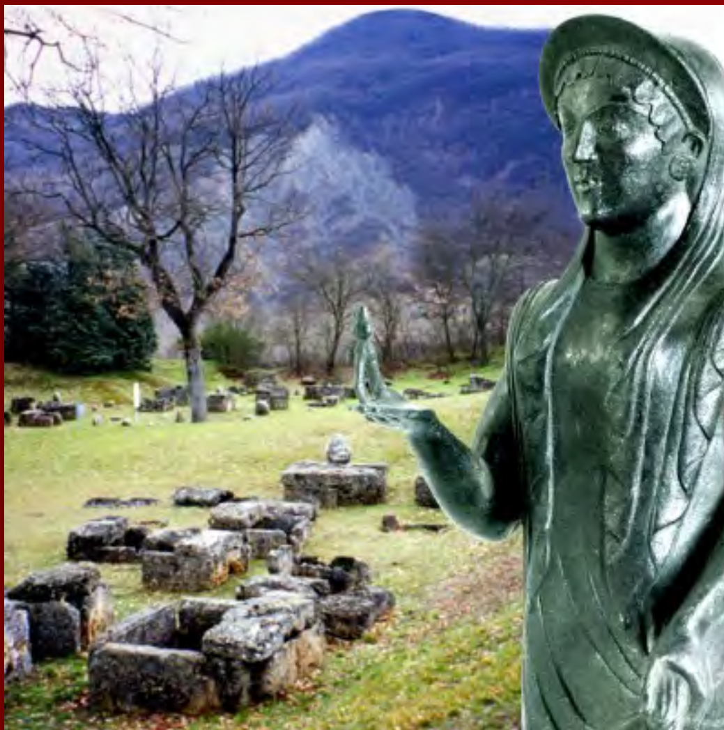
La signora di Marzabotto ambientata nella necropoli orientale