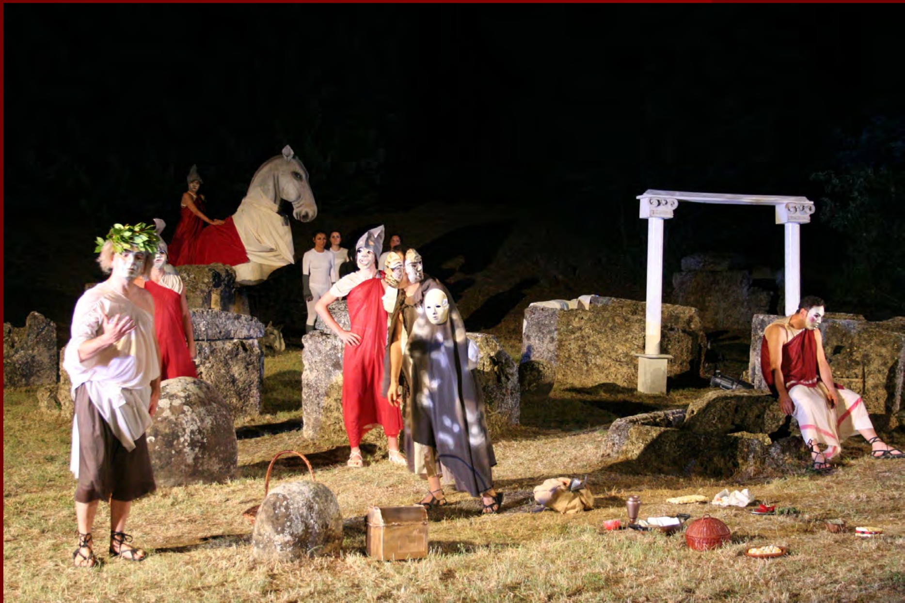
Necropoli orientale “I Cavalieri”