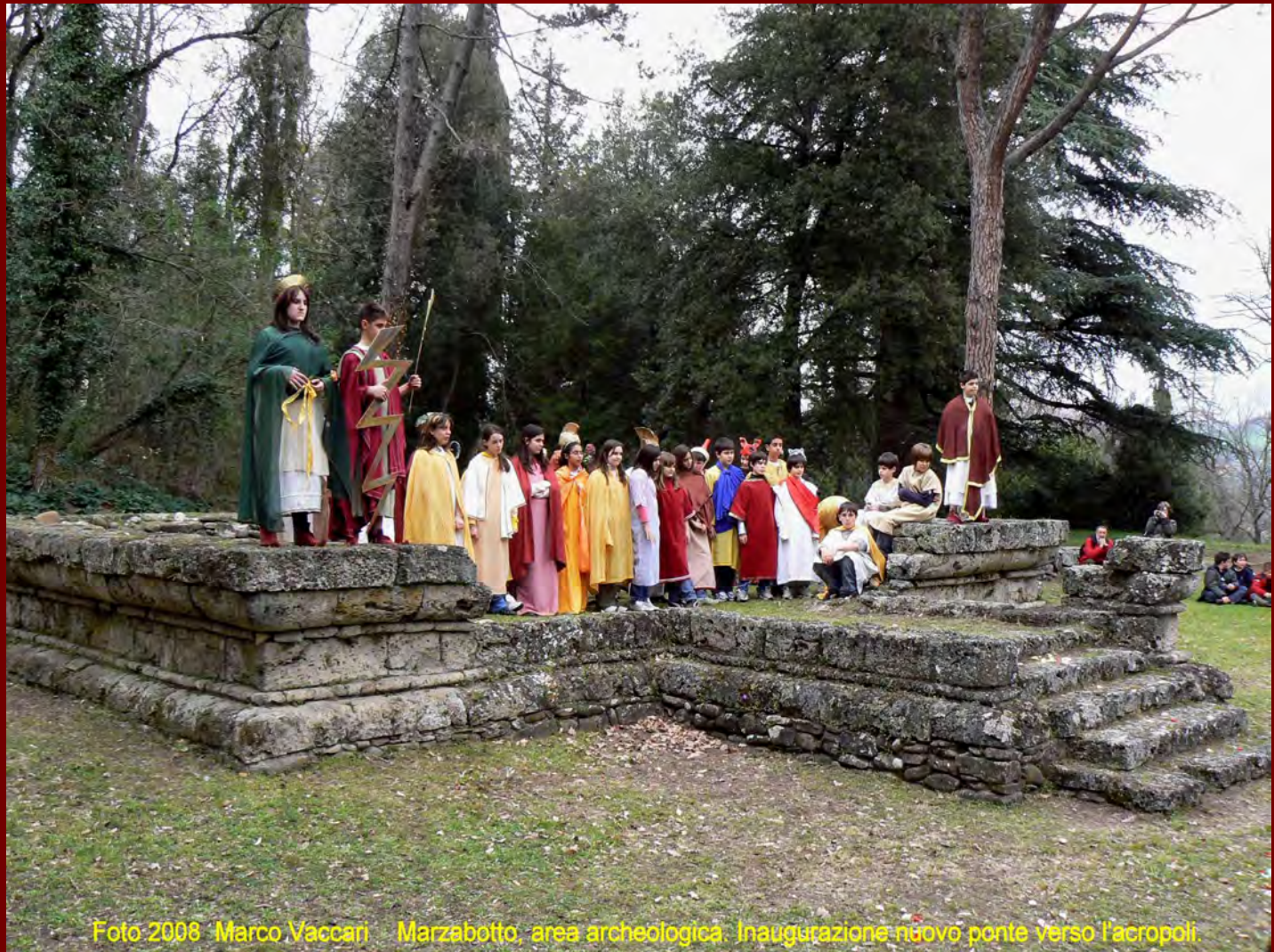
Foto 2008 Marco Vaccari Marzabotto, area archeologica. Inaugurazione nuovo ponte verso l'acropoli.