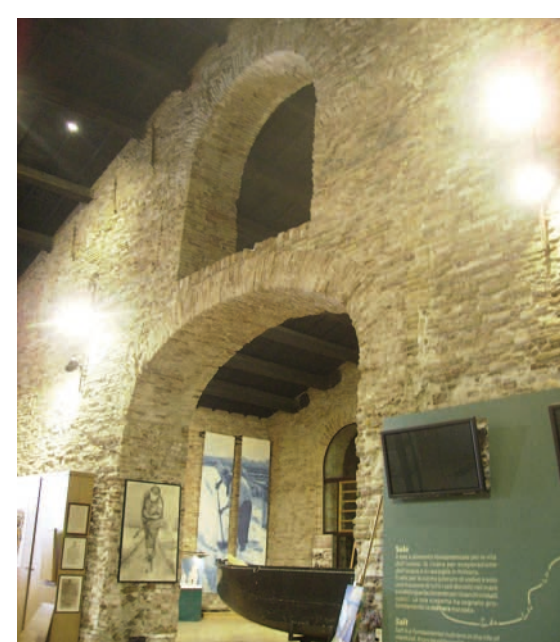
Cervia (RA), Magazzino Torre: un particolare della muratura interna