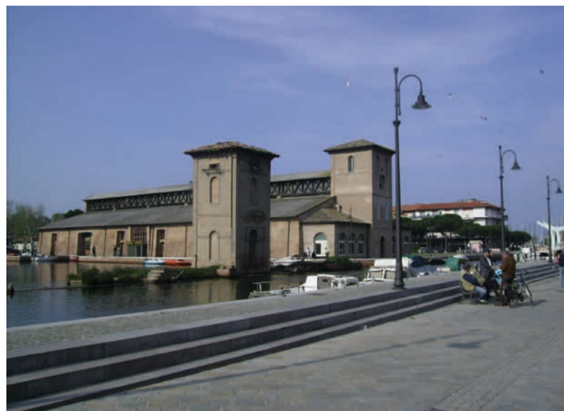
Cervia (RA), Magazzino Darsena: veduta generale