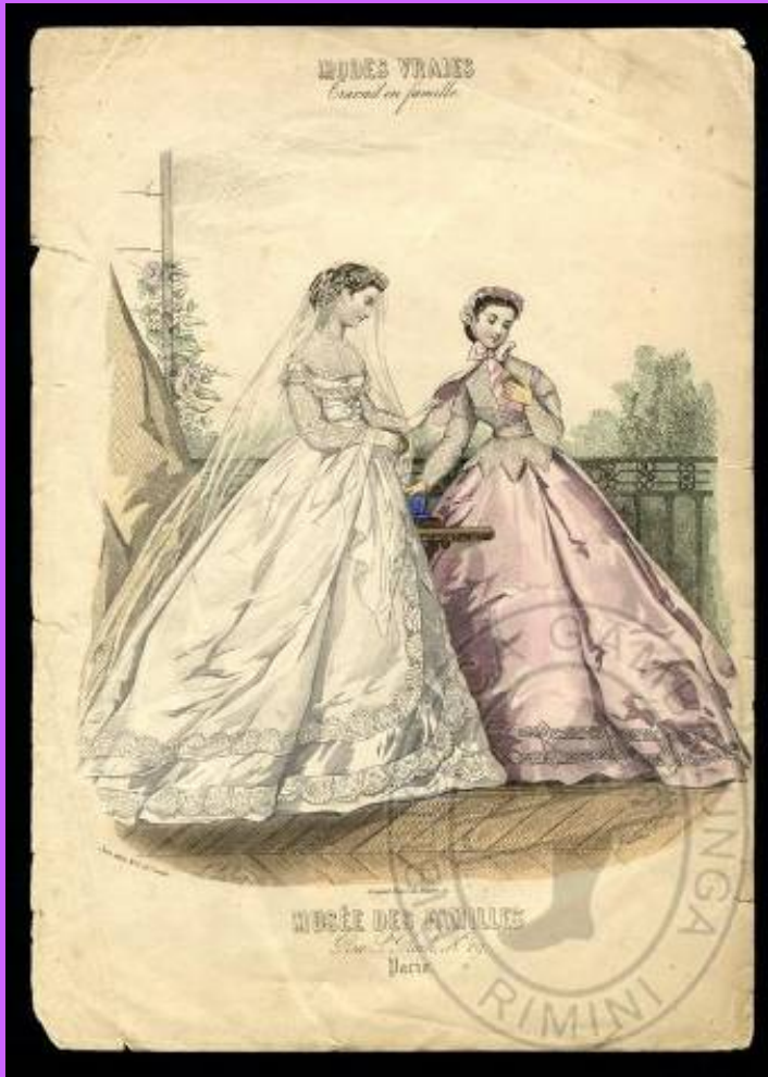
Tavola incisa all'acquaforte dalla rivista "Modes vrais Musée des familles", 1866.

Nella slide a seguire è la scheda di catalogo consultabile in IMAGO all'indirizzo: