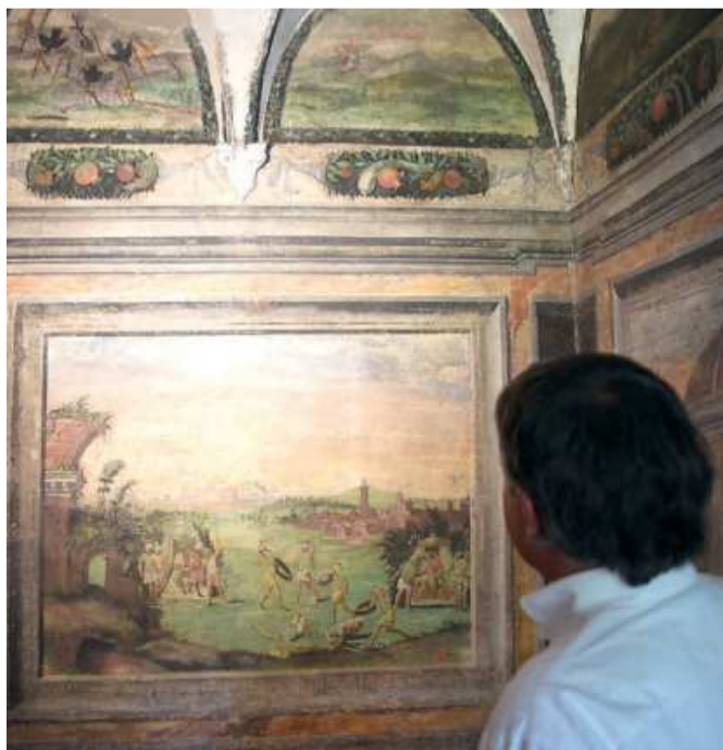
Un visitatore all'interno del Mauriziano