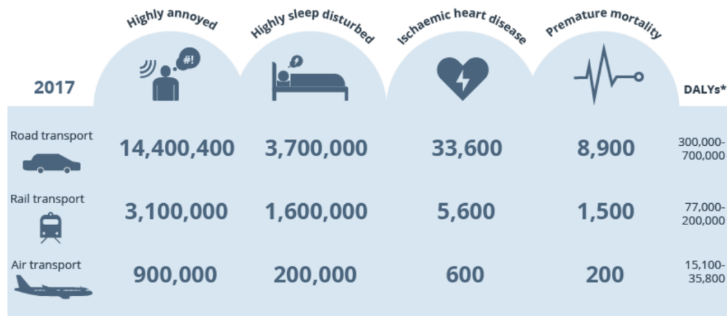
Fig. 3. Stato di attuazione dei Piani di classificazione acustica al 31 dicembre 2022. Il 78% dei Comuni in regione ha approvato la classificazione acustica, coinvolgendo circa il 93% della popolazione regionale. [https://webbook.arpae.it]