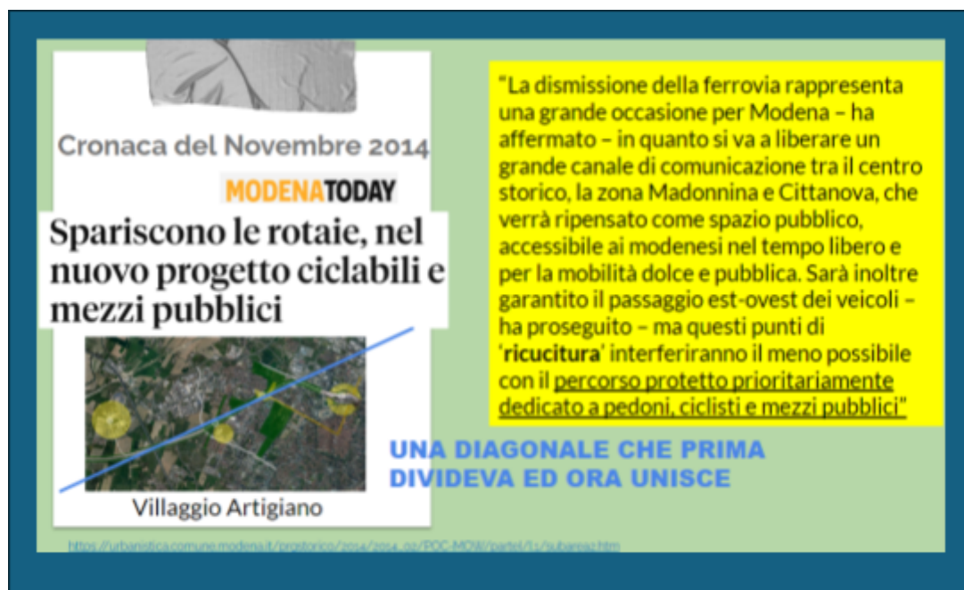
Fig. 3. Articolo di giornale da ModenaToday del Novembre 2014

Parallelamente il Villaggio Artigiano è un quartiere nato per essere destinato all'artigianato e alla piccola impresa nell'immediato dopoguerra per soddisfare la necessità di fornire occupazione ed abitazioni agli operai rimasti disoccupati