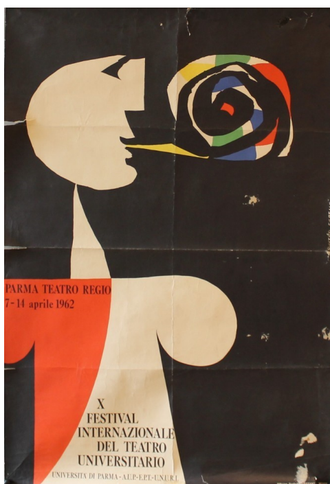
Fig. 1; Manifesto del X Festival Internazionale del Teatro Universitario, Milanomanifesti.it

Presero parte al Festival sette Nazioni, per un totale di nove compagnie: l'Italia col CUT di Parma, il CUT di Roma e la Compagnia stabile del Teatro Ca' Foscari di Venezia; la Gran Bretagna con il Department of Drama di Bristol; la Francia con il Groupe du Theatre Antique della Sorbona; la Spagna con l'Esbart Verdaguer di Barcellona; l'Unione Sovietica con l'Accademia di Coreografia di Leningrado; la Polonia con il Teatro Satirico Pstrag di Lotz ed, infine, la Cecoslovacchia con il Teatro Disk della Facoltà di Scienze Musicali di Praga.