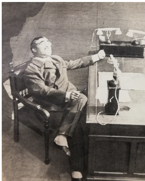
Fig. 7; Scena de Il Bagno di Majakowskij, fotografia tratta da Il Settimo Giorno , aprile del 1962.

La passione di Reggi per il Futurismo e le Avanguardie storiche lo portò a lavorare con Jerkovic 76 e gli attori del CUT di Parma su Il Bagno di Majakowskij, spettacolo preparato nel 1961 e presentato alle Celebrazioni Plautine di Sarsina 77 , a Erlangen, dove il CUT di Parma si classificò quarto, e infine a Zara, dove «il pubblico si divertì ma la critica fu piuttosto aspra col regista» 78 .