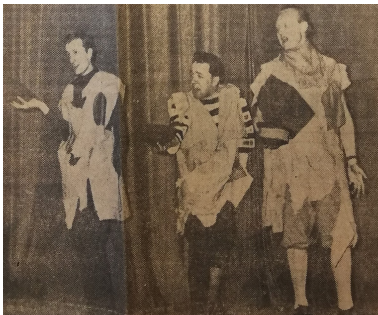
Fig. 4; Scena di Buonasera della Compagnia polacca Pstrag, fotografia tratta dal Carlino Sera, 11 aprile 1962.

Il giorno successivo, martedì 10 aprile, gli studenti polacchi del Teatro Satirico Pstrag di Lotz 14 (fig. 4), un teatro «polemico nei confronti dei problemi della vita contemporanea» 15 , presentarono Buona Sera , «uno spettacolo composito: canzoni, pantomime balletti, filastrocche» 16 , riecheggiante il circo o le farse dei burattini.