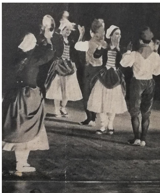
Fig. 3; Balletti spagnoli degli studenti di Barcellona, fotografia tratta da Vita, 19 aprile 1962.