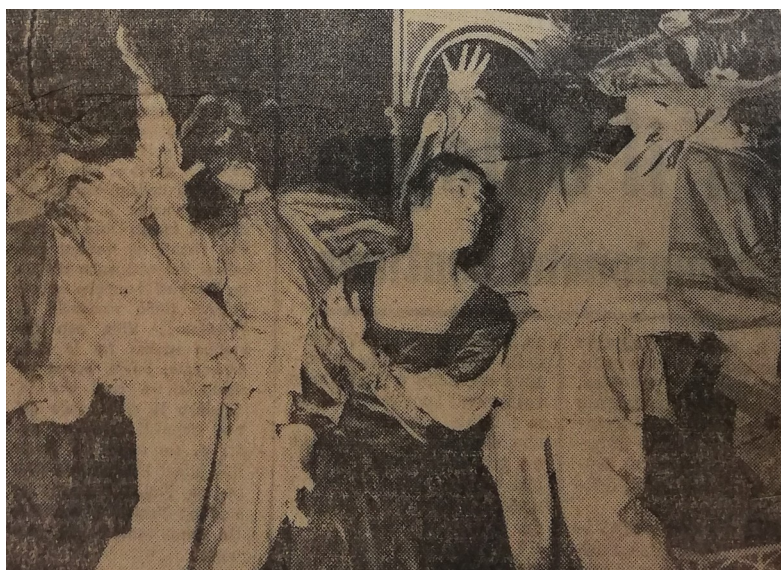
Fig. 5; Scena della Commedia degli Zanni del Teatro di Ca' Foscari di Venezia, fotografia tratta dal Carlino Sera, 16 aprile 1962.