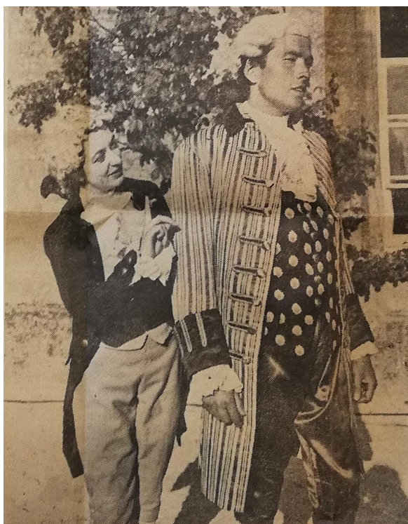
Fig 2; Scena di Pene d'amor perdute di Shakespeare, fotografia tratta da Vita, 19 aprile 1962.

La compagnia britannica, arrivata dopo ben ventisei ore di viaggio, fu accompagnata da quattro operatori della BBC, «muniti di curiosi [...] microfoni tascabili» 8 , che dovevano girare «un ampio documentario su Parma e il suo Festival» 9 per la televisione inglese.