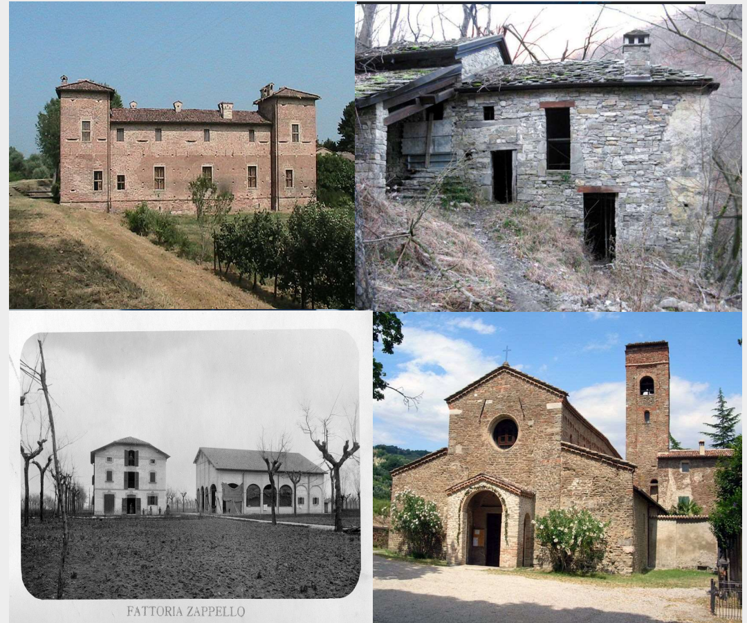
Immagini tratte da banca dati Pater

Restauro e valorizzazione del patrimonio architettonico e paesaggistico rurale